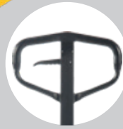
Ergonomik Kullanım Sağlayan Direksiyon