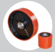
Kırmızı Poliüretan Teker