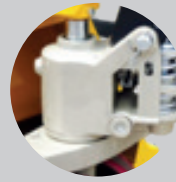
Entegre Döküm Pompa