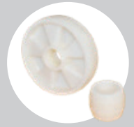
Beyaz Naylon Teker