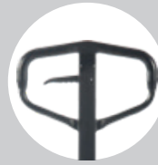
Ergonomik Kullanım Sağlayan Direksiyon